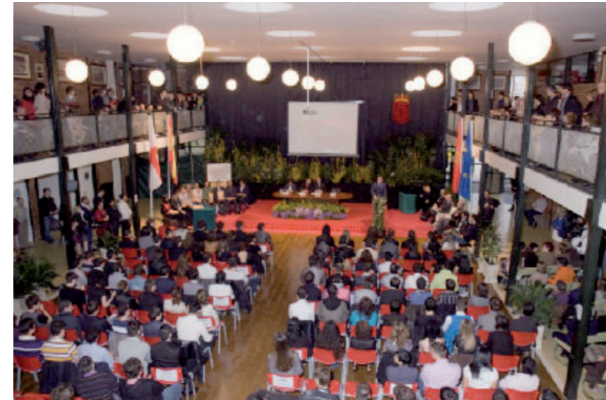
Vestíbulo del Centro. Acto de Graduación del alumnado Grado Superior y Bachillerato

Polígono Industrial, vial B, par. 36 Automoción. Tfno. 948827575 Soldadura. Tfno. 948825599