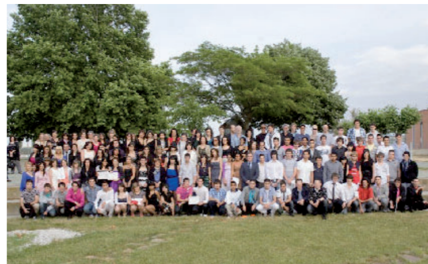
Exteriores del Centro. Acto de Graduación del alumnado de Grado Medio y PCPI