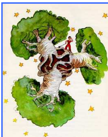
Antoine de Saint-Exupéry, El principito (Adaptado)

Siguiendo las indicaciones del principito, dibujé dicho planeta. Aunque no me gusta el papel de moralista, el peligro de los baobabs es tan desconocido y los peligros que puede correr quien llegue a perderse en un asteroide son tan grandes, que no vacilo en hacer una excepción y exclamar: "¡Niños, atención a los baobabs!" Y sólo con el fin de advertir a mis amigos de estos peligros a los que se exponen desde hace ya tiempo sin saberlo, es por lo que trabajé y puse tanto empeño en realizar este dibujo. La lección que con él podía dar valía la pena. Es muy posible que alguien me pregunte por qué no hay en este libro otros dibujos tan grandiosos como el dibujo de los baobabs. La respuesta es muy sencilla: he tratado de hacerlos, pero no lo he logrado. Cuando dibujé los baobabs estaba animado por un sentimiento de urgencia.