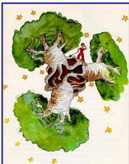
Antoine de Saint-Exupéry , Printze txikia (moldatua)

Eta printze txikiaren oharrak kontuan harturik, marraztu egin nuen planeta hura. Ez naiz moralisten mintzamoldearen zalea. Baina baobaben arriskua hain da ezezaguna, eta asteroide batean galtzea hain izan daiteke arriskutsua, behingoz salbuespena egitea erabaki baitut. Eta diot: “Haurrok! Kontuz baobabekin, gero!”. Eta, nire antzera, ene lagunek aspaldidanik zuten arrisku ezezagun horren berri emateko asmotan, lan handia egin nuen marrazki harekin. Eman nien lezioa kontuan hartzekoa zen. Beharbada, zeuen buruari galdegingo diozue: “Zergatik ez ote dago liburu honetan baobabena bezain marrazki handiosik?”. Erantzuna oso erraza da: saiatu, saiatu naiz, baina lortu ez. Baobabak marraztu nituenean, presazko sentimendu batek bultzaturik jardun nuen.