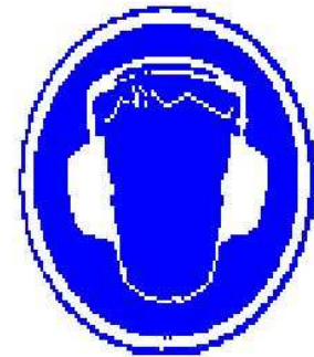
Entzumena babestea nahitaezkoa

4. ERABAT DEBEKATURIK dago makinek dakartzaten segurtasun neurriak (segurtasun-gailuak eta gordelekuak) ezabatzea. Sistema hauek deuseztatzen badira ez da Laneko Arriskuei Aurrea Hartzeko Legea zuzenean betetzen eta horrek zigorra izan dezake. Maiz egiazta ezazu neurri horiek zuzen daudela. Makina erabiltzen hasi baino lehenago, ziurta ezazu babes guztiak zuzen jarrita eta egokituta daudela.