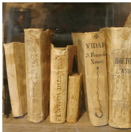
Libros antiguos en el Castillo de Javier