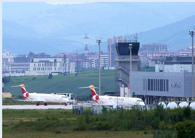
Egilea: Javier Bergasa

Kontuan hartu nola sortu behar duzun testua: