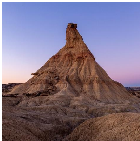
Castildetierra Errege-Bardeen Parke Naturala