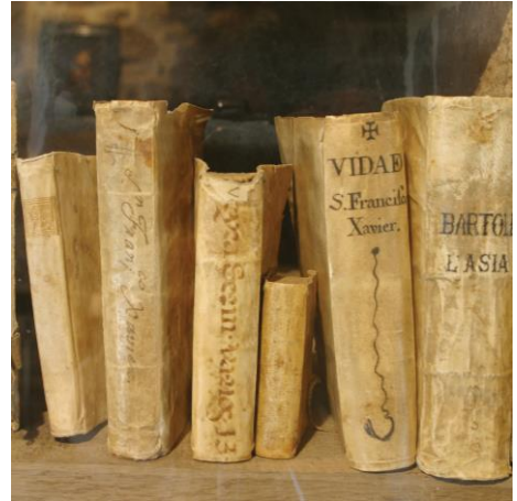
Libros antiguos en el Castillo de Javier