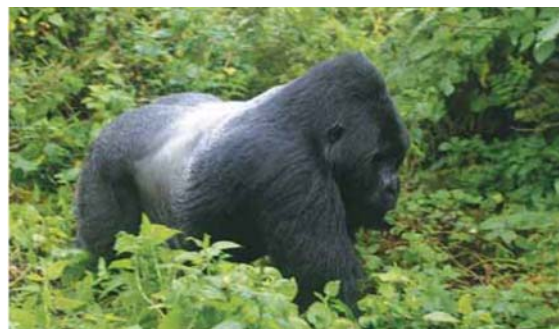
Viajes El Corte Inglés. Países lejanos, 2010. Adaptado.

Los precios publicados incluyen los vuelos de Nairobi-Kigali - Nairobi, sujetos a posibles modificaciones, por lo que se informará del precio definitivo en el momento de confirmación de la reserva.