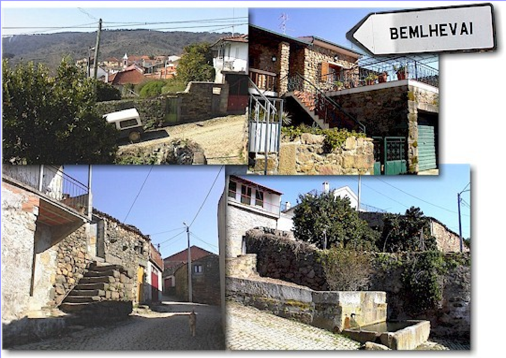
Bemlhevai (Vila Flor)