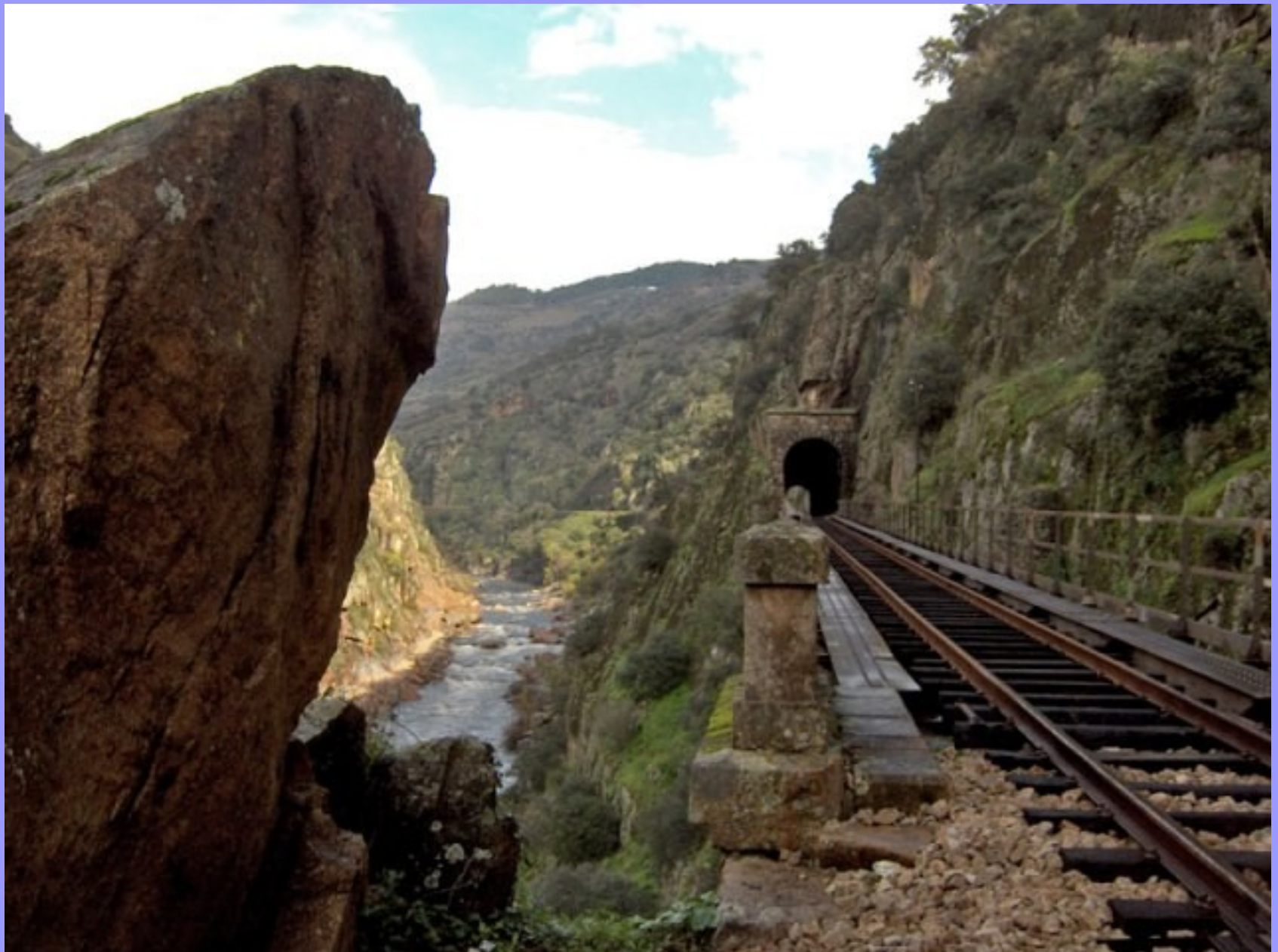
Linha do Tua. De Mirandela à estação do Tua