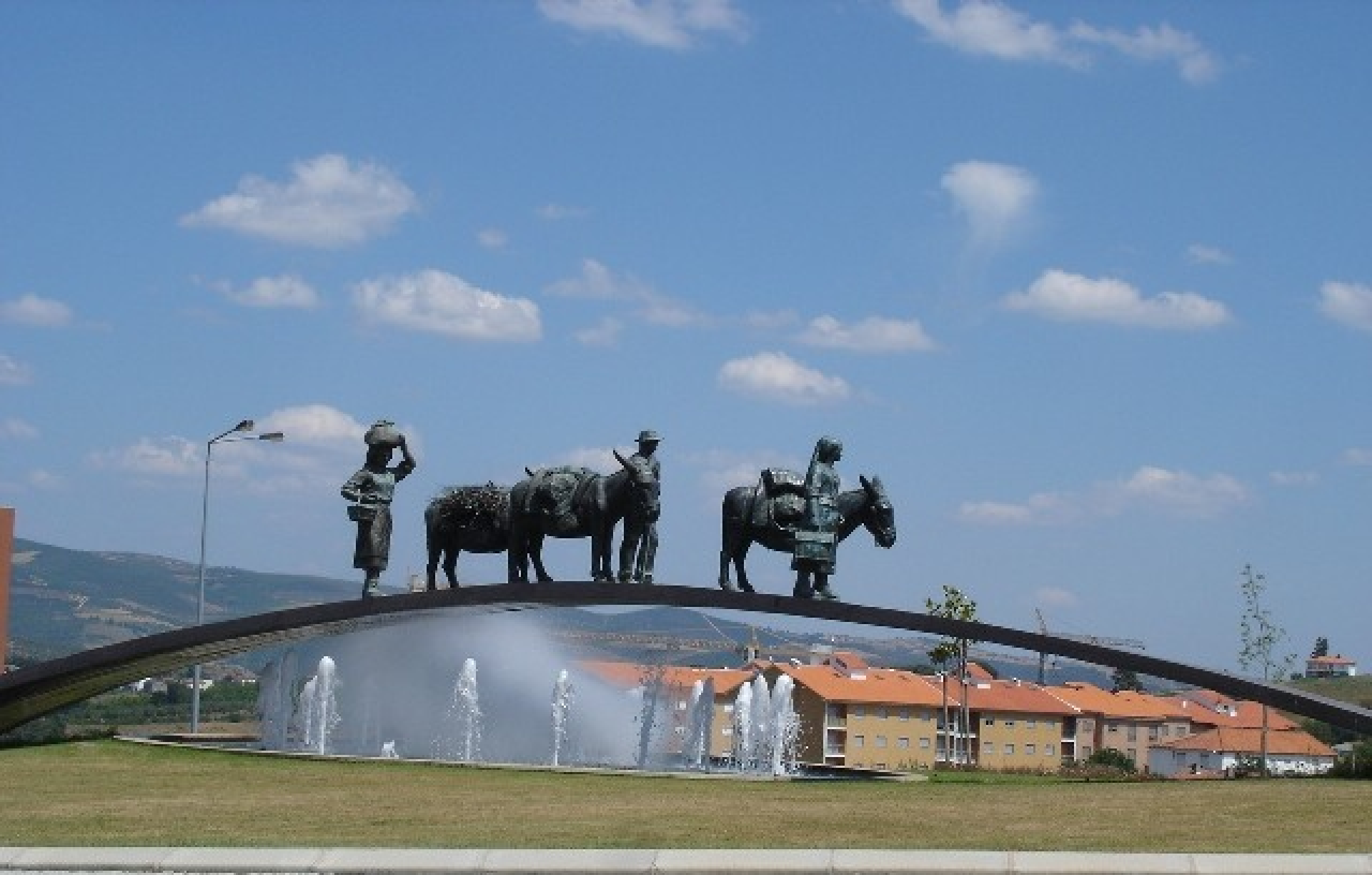
Rotundas em Bragança