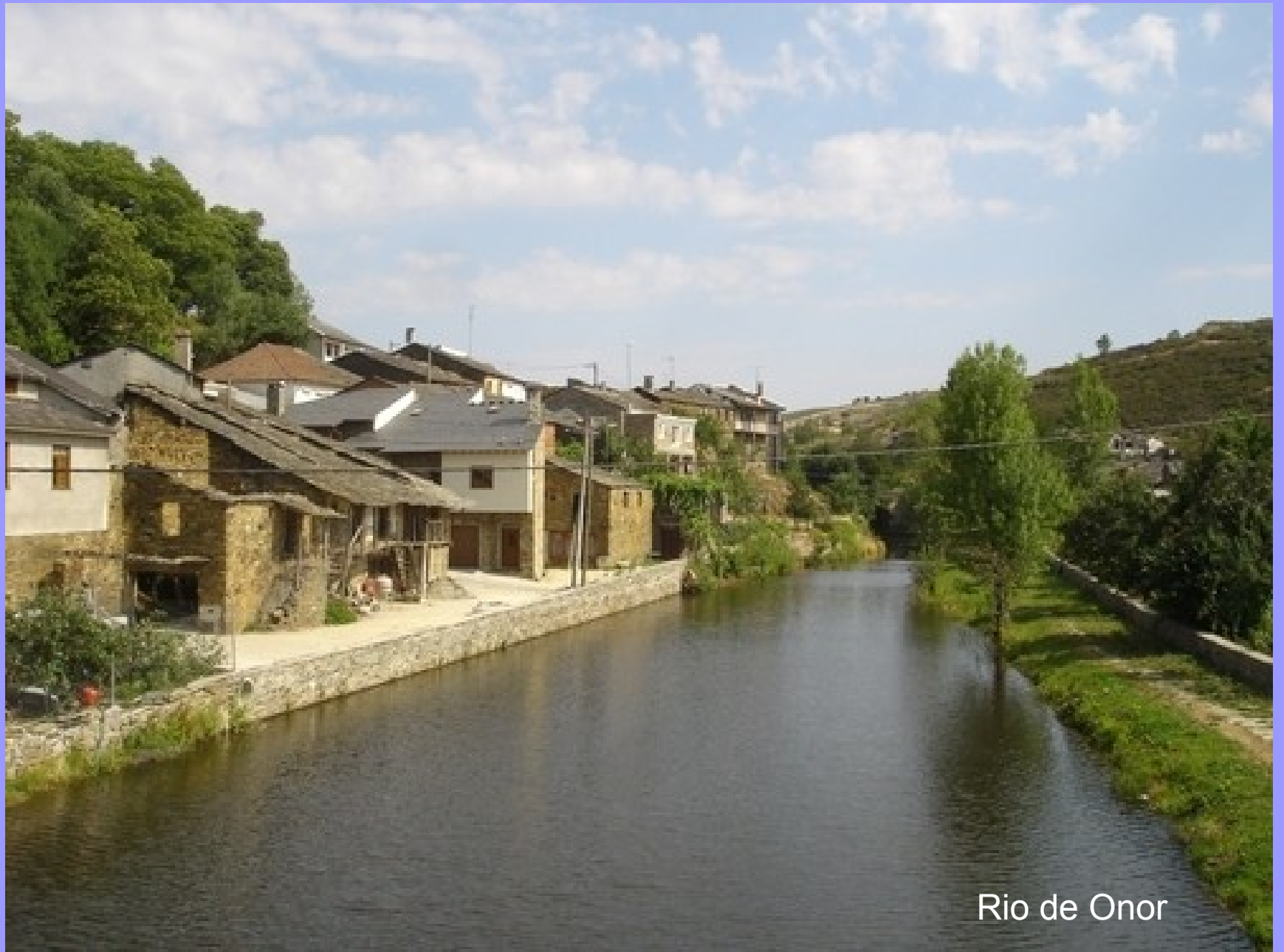
Rio de Onor