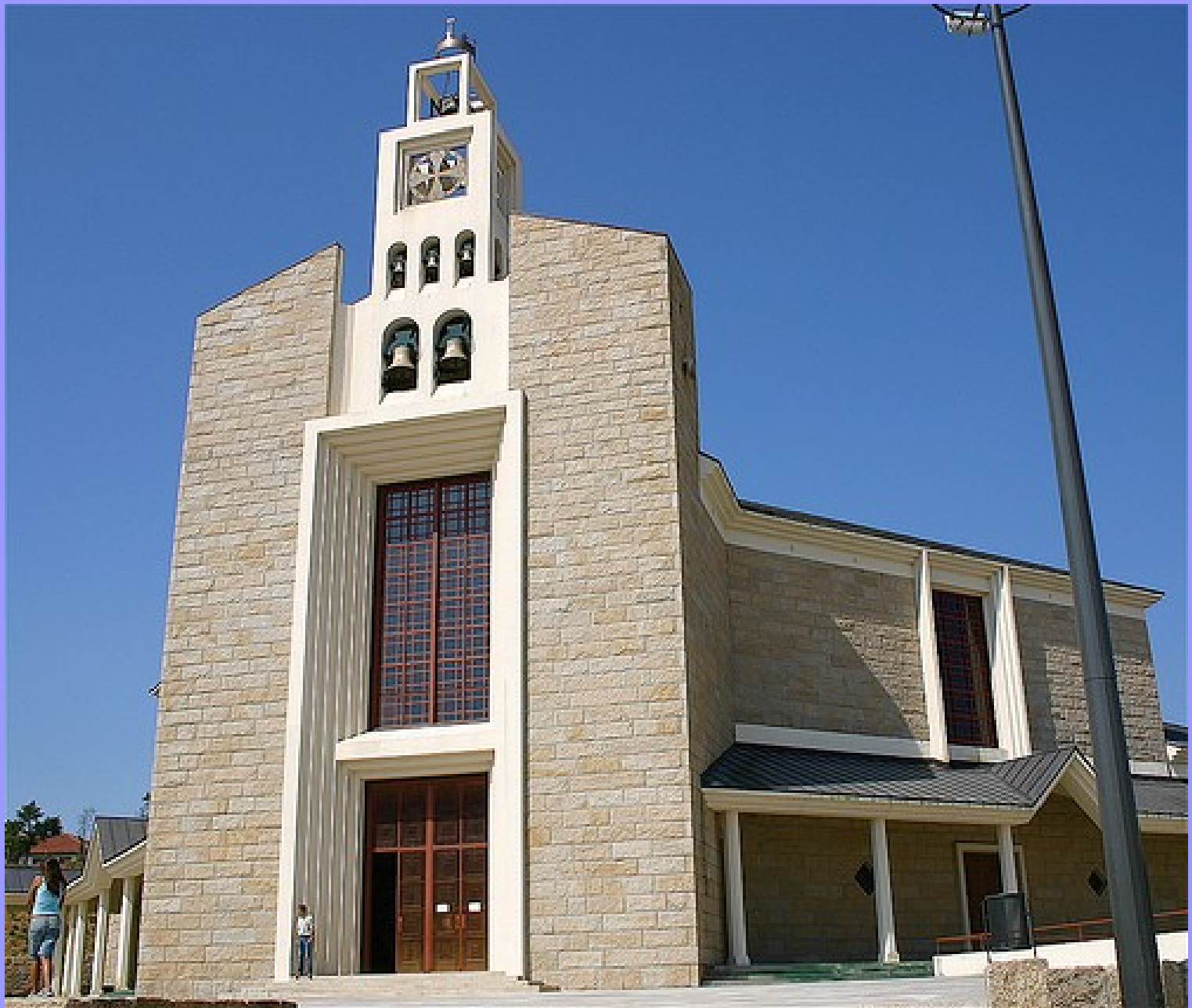
Bragança – Nova Sé