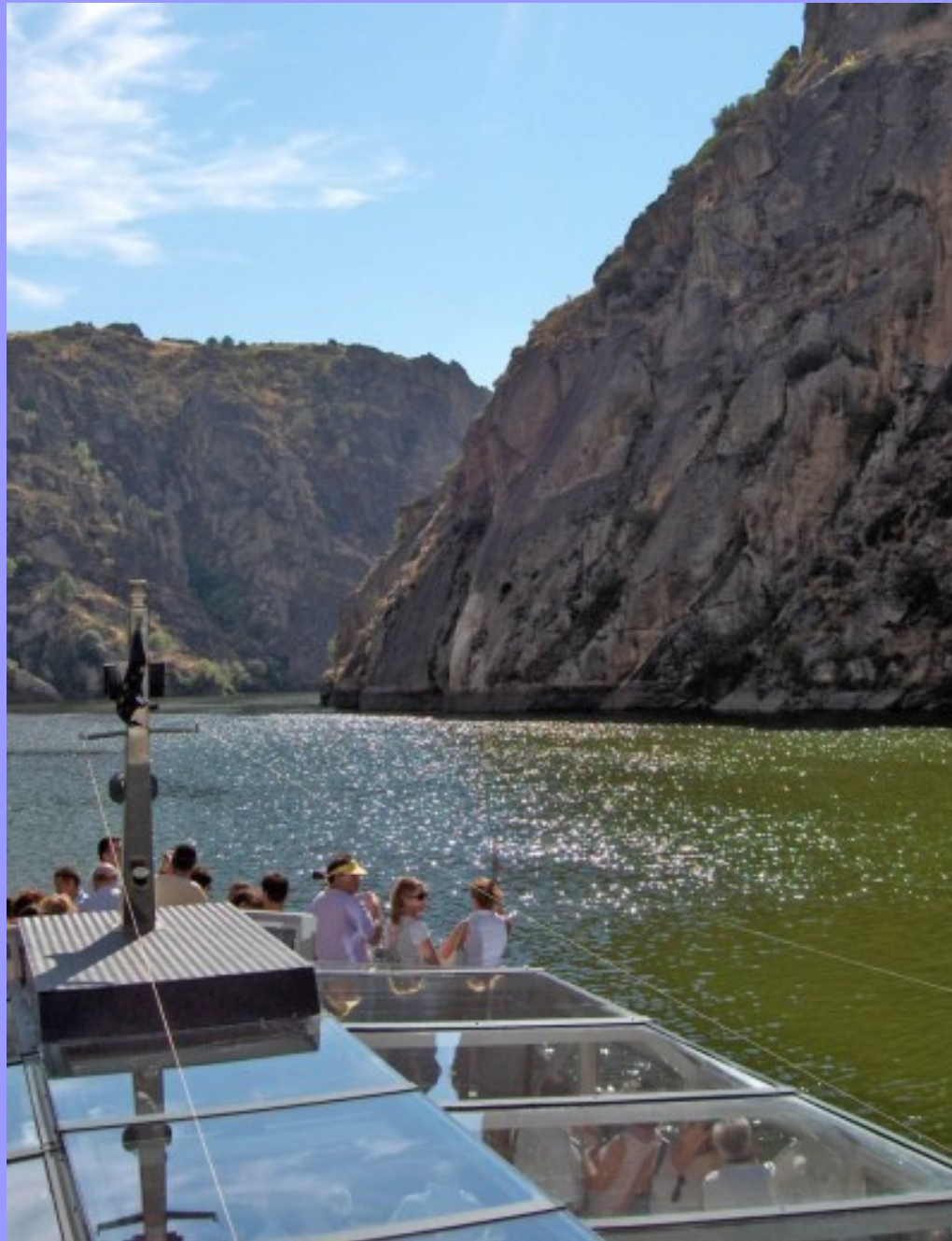
Rio Douro (Miranda do Douro)