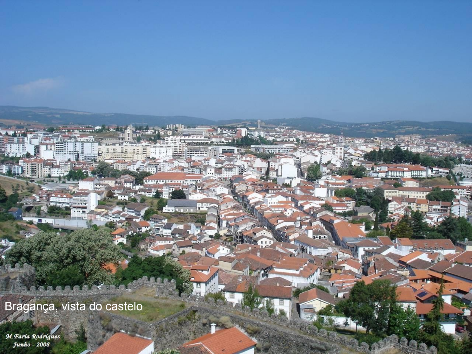
Bragança, vista do castelo