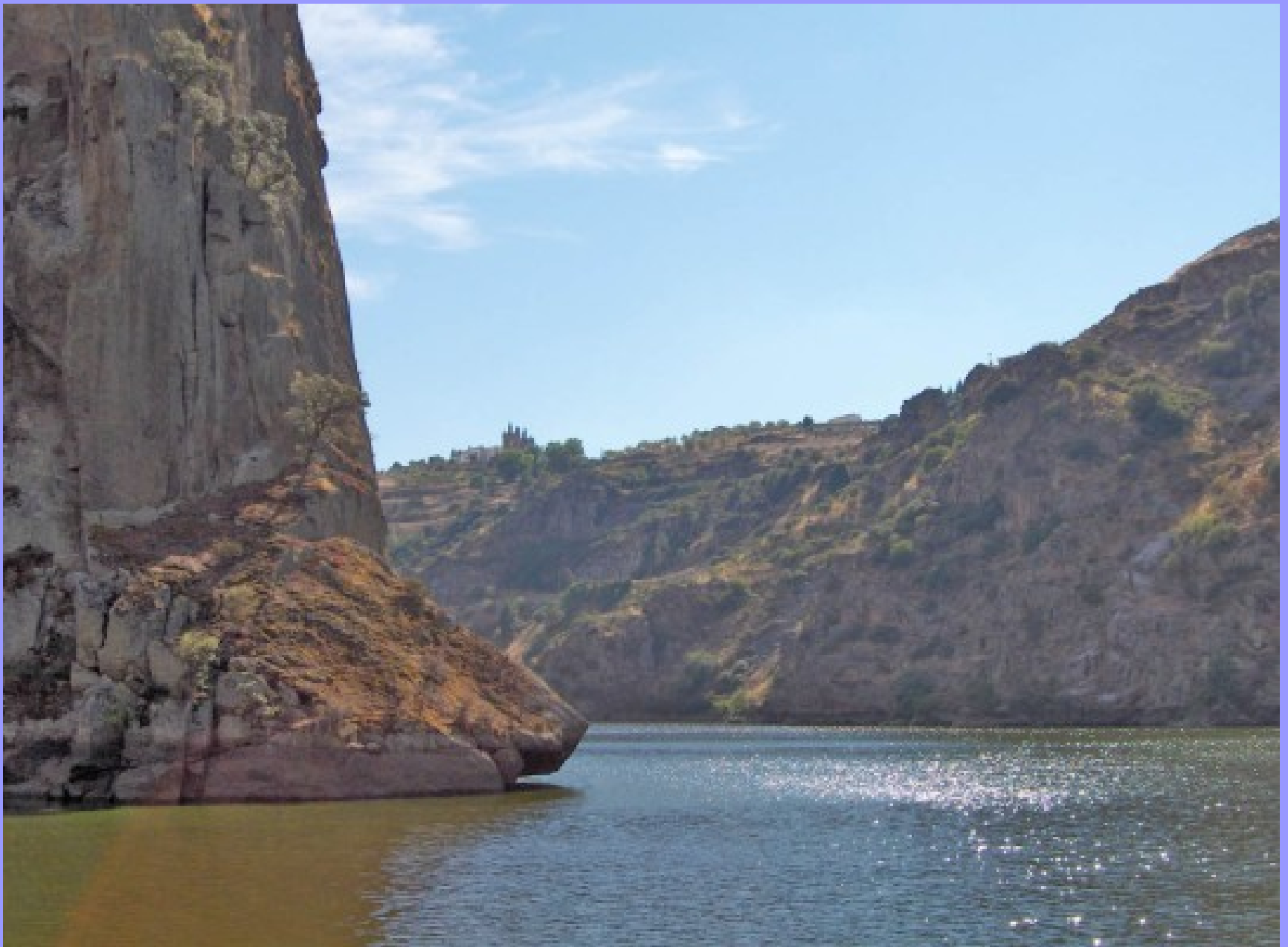
Rio Douro – Miranda do Douro