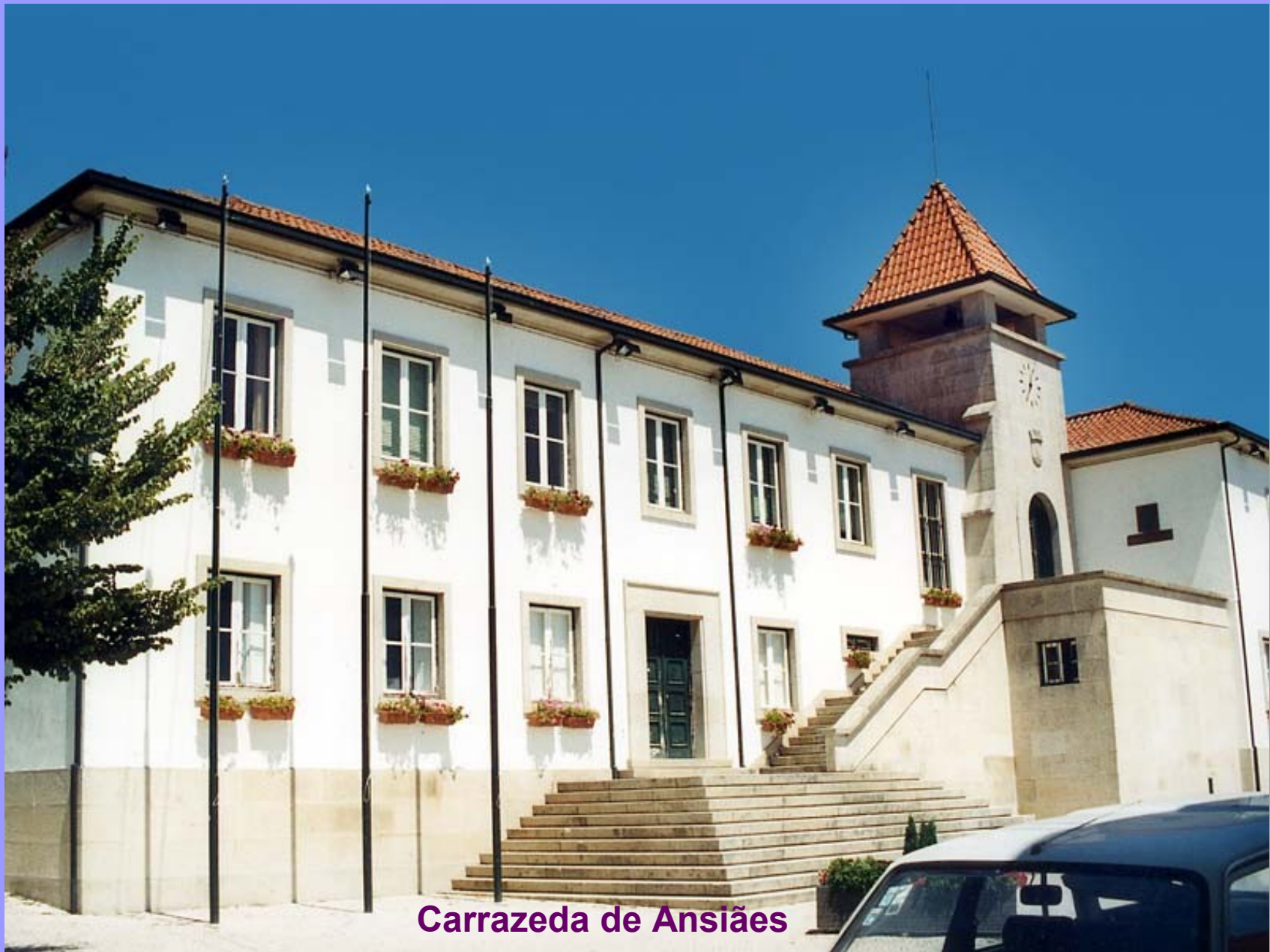
Carrazeda de Ansiães