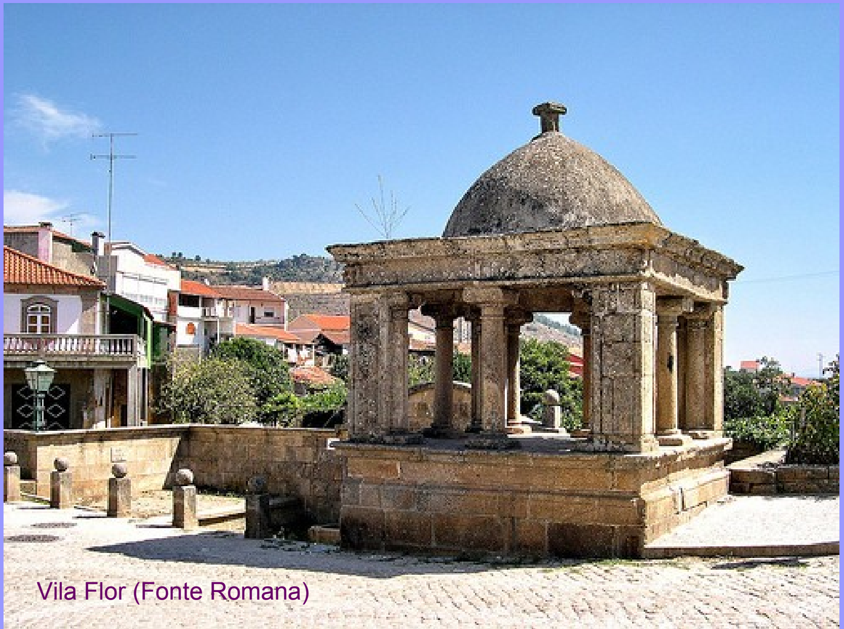
Vila Flor (Fonte Romana)