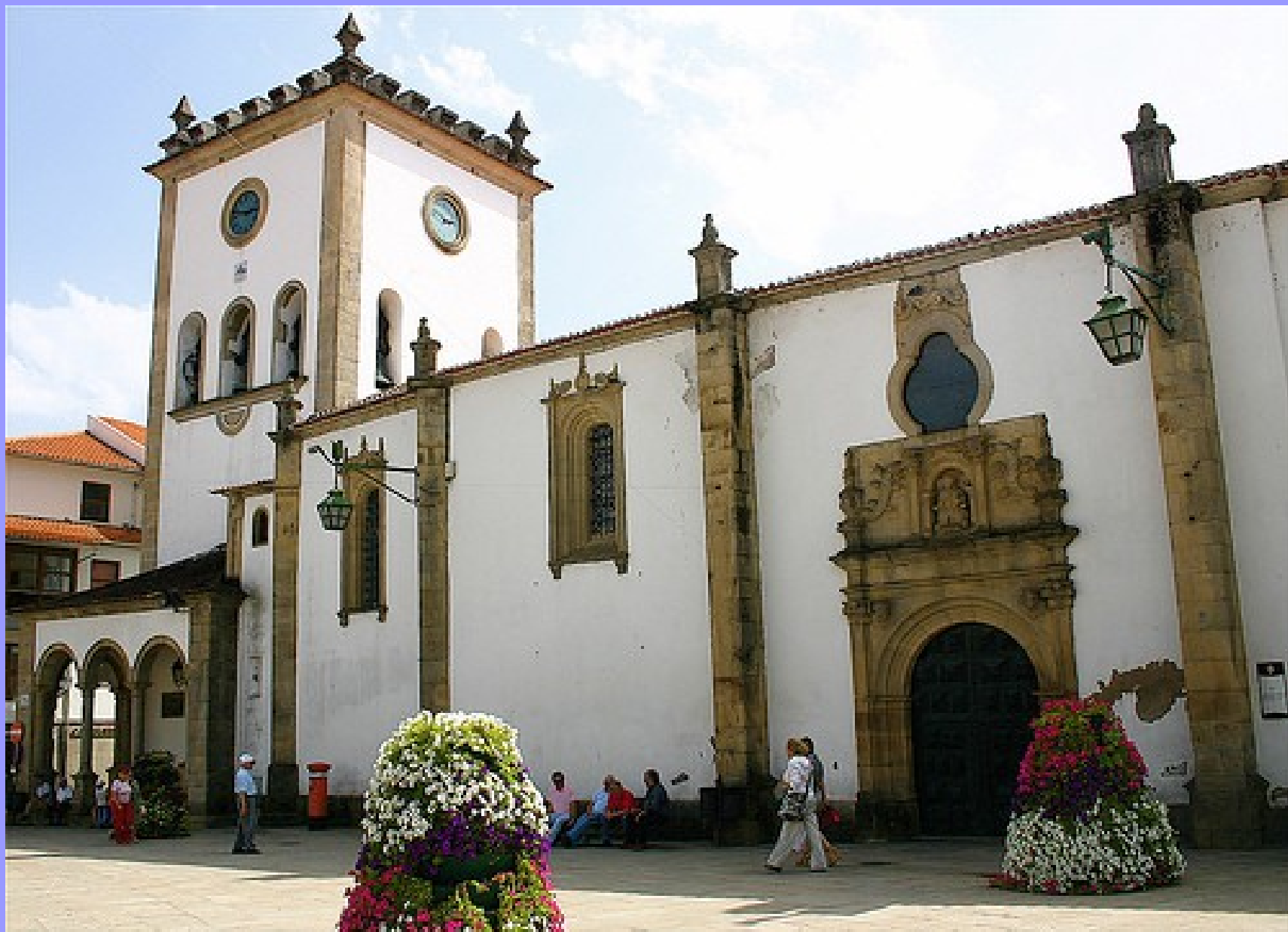
Sé - Bragança