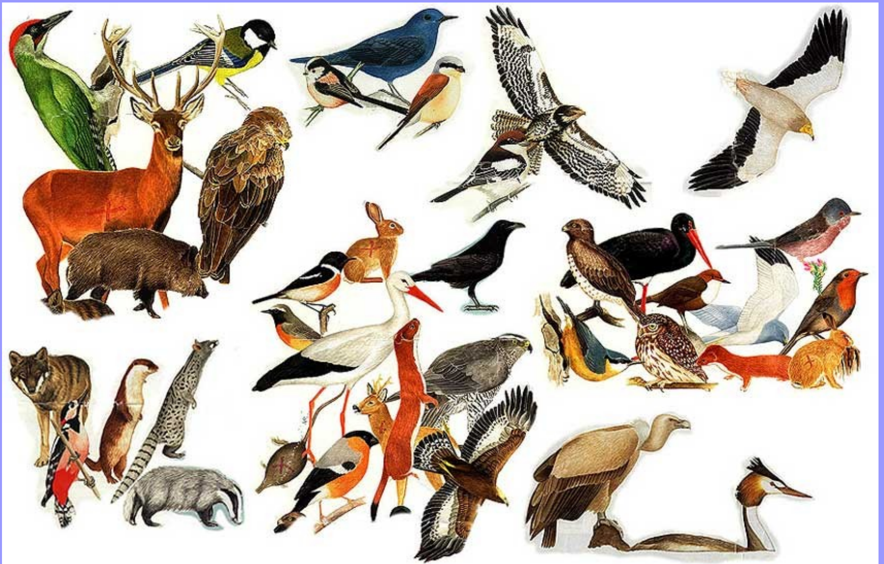
Fauna do Parque Natural de Montesinho