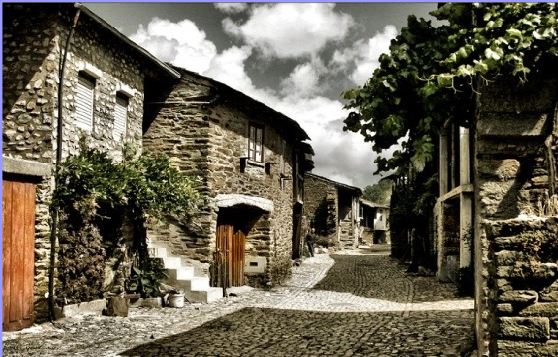
Rio de Onor