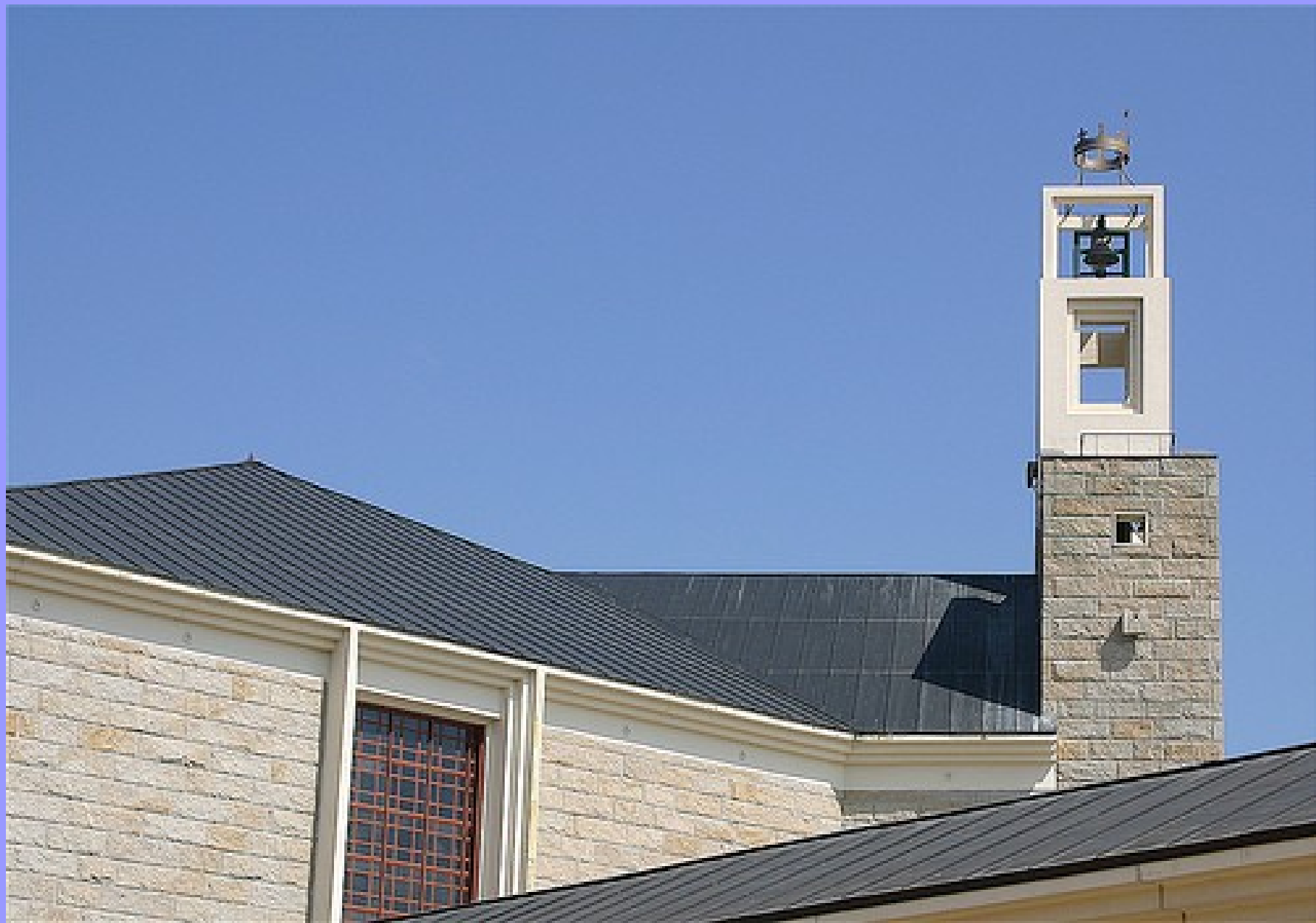
Bragança – Nova Sé