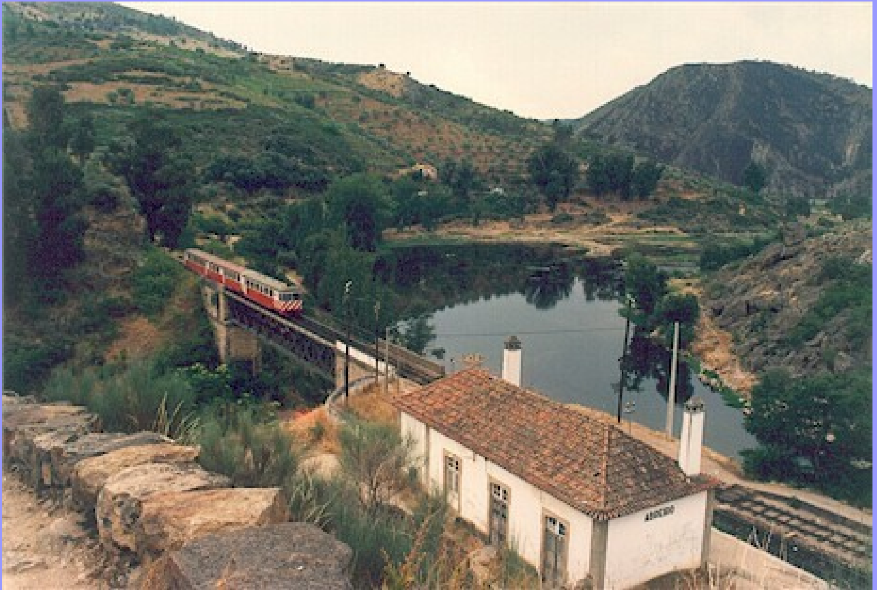
Estação Abreiro – Mirandela - Linha do Tua